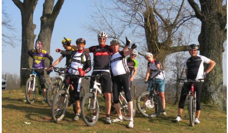
Unser Frühjahrstraining geht ins dritte Jahr – Stuttgart statt Malle

auch keine Verpflichtung, an allen Tagen dabei zu sein oder bei den Touren bis zum Schluss mitzufahren. Flexibilität wird hier groß geschrieben, Spaß zu haben und ein Grundlagen-Fundament für unser Bike-Jahr zu legen stehen im Vordergrund. Unser Ziel ist es, einen Interessenten-Kreis an MTBikern für dieses Frühlings-Trainingslager zusammenzuführen.