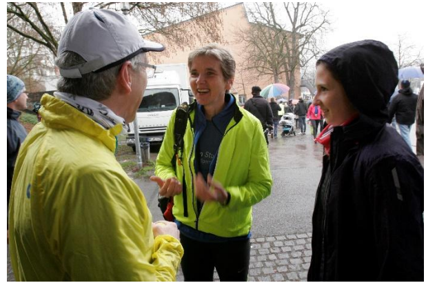
Vor dem Lauf