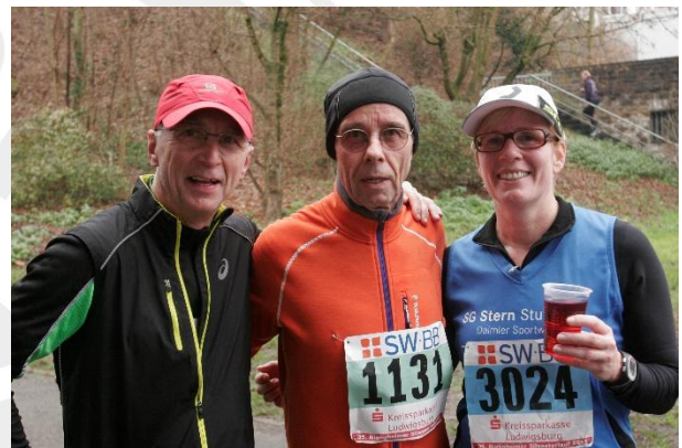
Nach dem Lauf