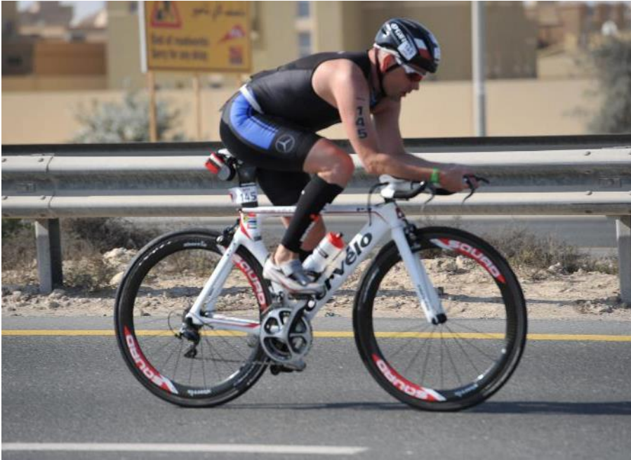
90 km mit dem Rad durch Dubai in die Wüste und zurück