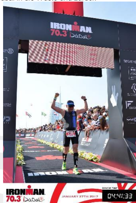
... es ist geschafft!