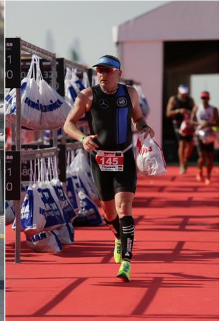
Auf zu den Halbmarathonrunden: 3*7km