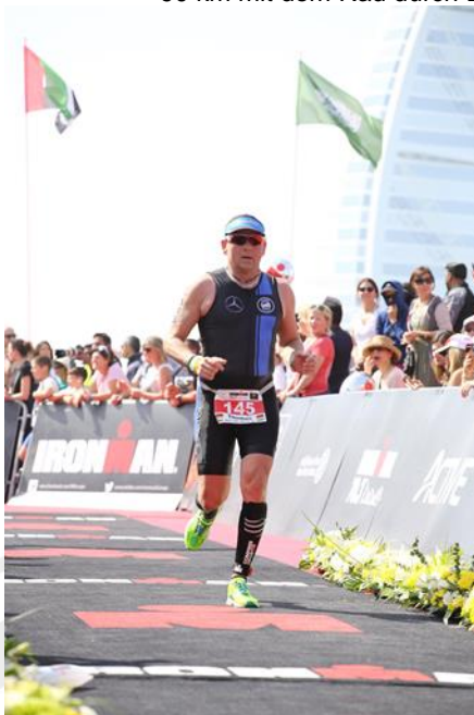
Das Ziel naht ...